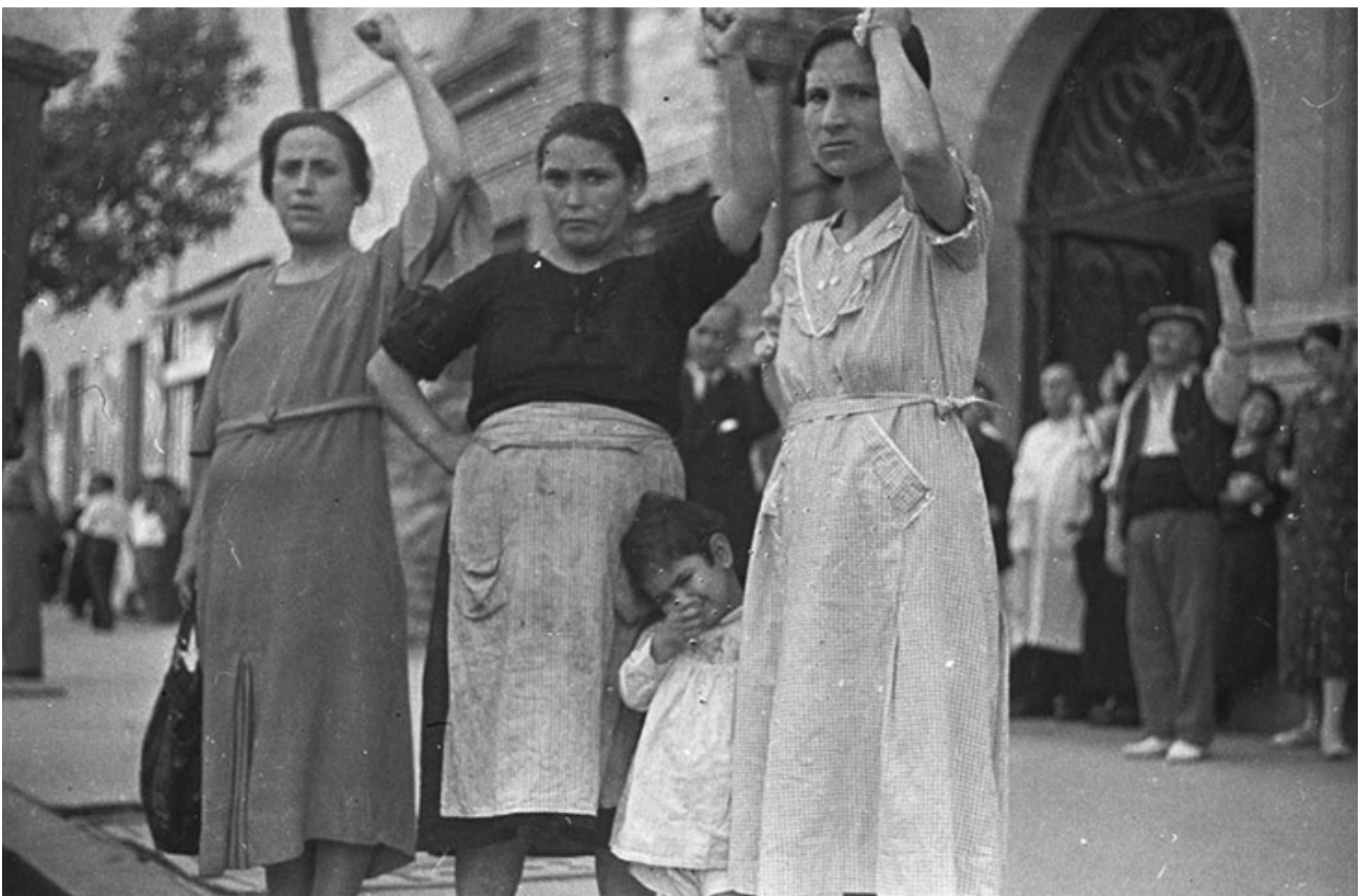
Mujeres durante el cortejo fúnebre del general Lukács. Valencia, 12 de junio de 1937.

Lugar de celebración: Universidad del País Vasco-Euskal Herriko Unibertsitatea, Facultad de Letras (Vitoria-Gasteiz)